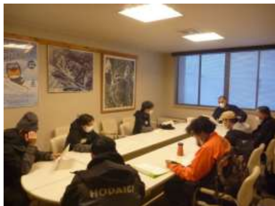
安全教育講習風景（技能向上）

また、シーズン営業中にも定期的に実務研修等を実施し、安全輸送に対する意識の保持に努めています。さらに、索道従事者を専門機関主催の各種研修会等へ参加させています。